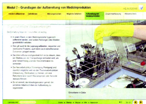
Abb. 2: Die Module sind mit zahlreichen Bildern und Animationen versehen. Unten links ist der Lernfortschritt des Teilnehmers dokumentiert.

Die zehn aufeinander aufbauenden Einheiten des Kursprogramms vermitteln in den Anfangsmodulen die rechtlichen Grundlagen sowie fundierte Kenntnisse zur Praxishygiene, zur Instrumentenkunde und zur Verpackung, Kennzeichnung und Lagerung von Medizinprodukten. In den höheren Modulen werden die Prinzipien der Aufbereitung von Reinigung, Desinfektion und Sterilisation behandelt. Daran schließen sich Einheiten zur Validierung von Reinigungs-